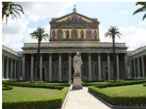
San Paolo Fuori Le Mura