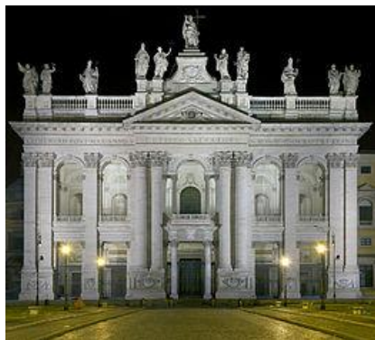
Basilica di San Giovanni

Riduzioni a gruppi minimo 4 persone / Notte extra a 25 euro a persona al giorno / Trasferimenti aeroporto da 35 a 45 euro (fino 4 persone per auto) / I prezzi si intendono esclusa tassa di soggiorno (3,50 euro a persona al giorno)