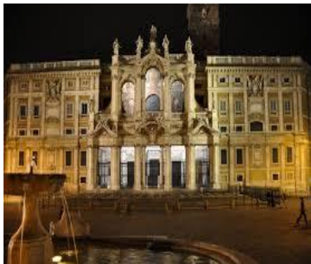
Santa maria Maggiore